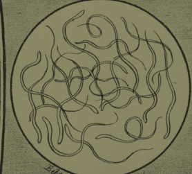
Cells found in some Bones