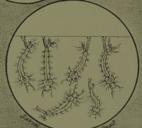
Larva of the Common Grass