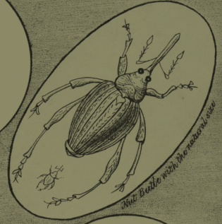
Ain Beetle with the natural eye