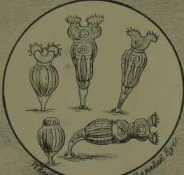
Microscopic animals as they are naturally