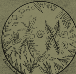
Observation of Parasites